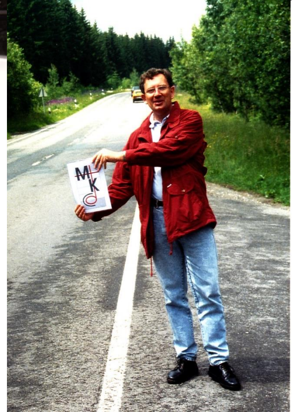
überall im Einsatz